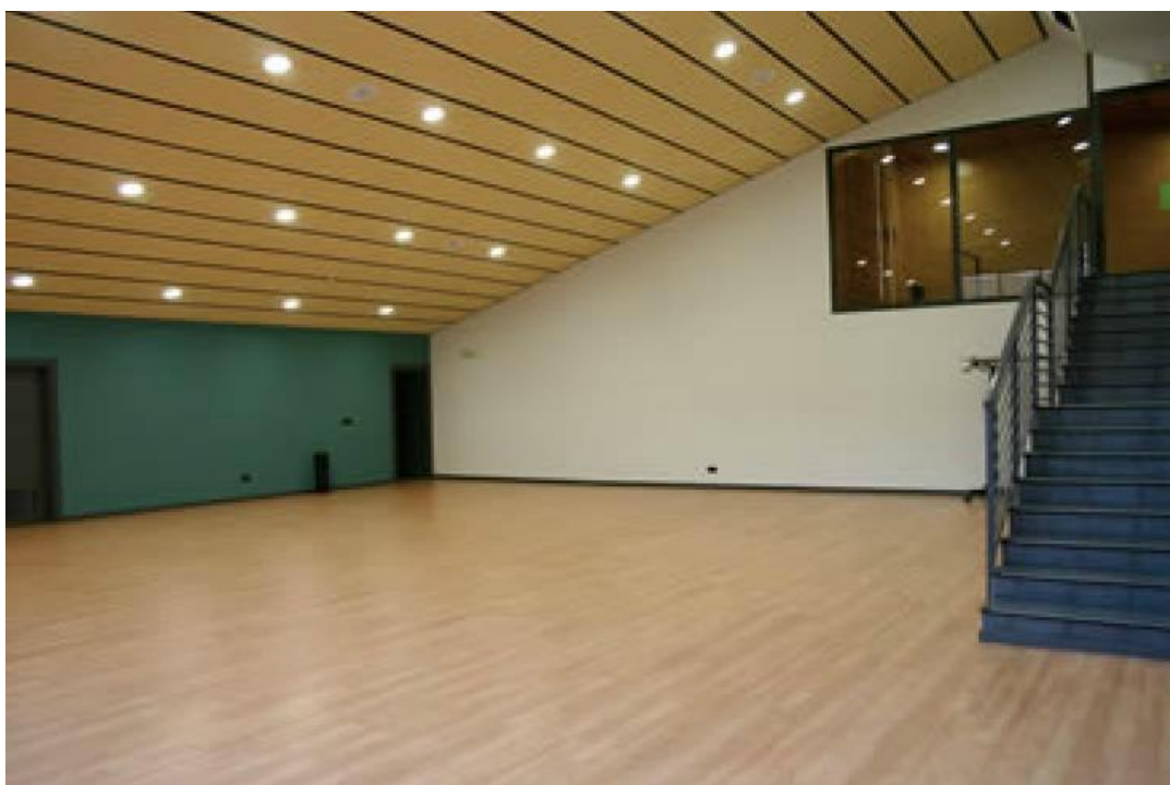
Vista desde acceso exterior