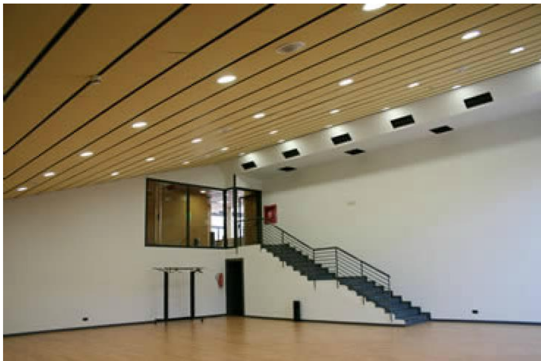
Vista del acceso interior