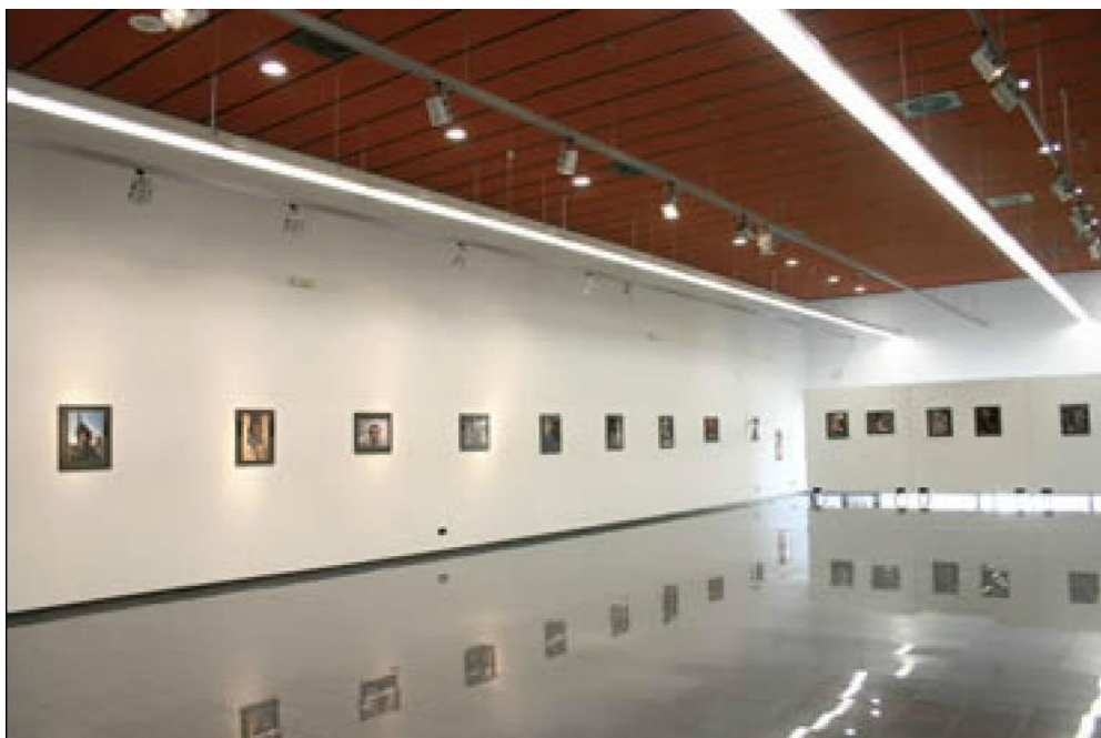
Vista desde el acceso