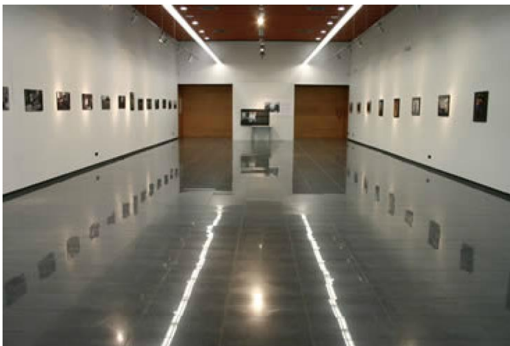
Vista desde el fondo