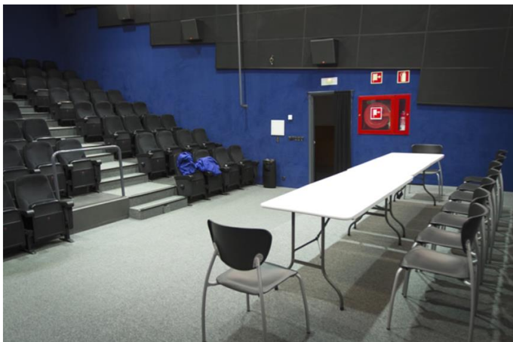
Vista desde el escenario